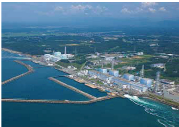
Centrala nucleară de la Fukushima

Prin urmare, principiile de management al SSM ar trebui să prevaleze în cazul instalațiilor cu risc major de accident. În plus, principiile normelor și codurilor de practici ale OIM privind protecția lucrătorilor împotriva radiațiilor ionizante sunt, de asemenea, aplicabile pentru sectorul energiei nucleare.