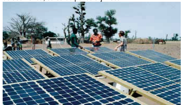
Panouri voltaice solare în Senegal

Un proiect de clădire ecologică poate include noi locuri de muncă verzi (de exemplu, instalarea de panouri solare) și tradiționale în egală măsură (cum ar fi turnarea betonului), aspecte care, de multe ori, implică cerințe mult mai stricte în termeni de know-how. Prin urmare, locurile de muncă verzi din construcții vor avea o serie de riscuri profesionale similare celor tradiționale din construcții, cum ar fi cele legate de suprafețele de lucru și de deplasare, munca la înălțime, scule de mână și electrice, energie electrică, spații închise, precum și depozitarea și manipularea de produse chimice. Introducerea de situații noi (cum ar fi instalarea de echipamente de energie regenerabilă la înălțime sau alimentarea rețelelor electrice inteligente), combinate cu utilizarea de noi materiale de construcții (cărămizi, materiale izolante și vopsele care conțin nanomateriale etc.), poate fi, de asemenea, sursă de pericole și riscuri.