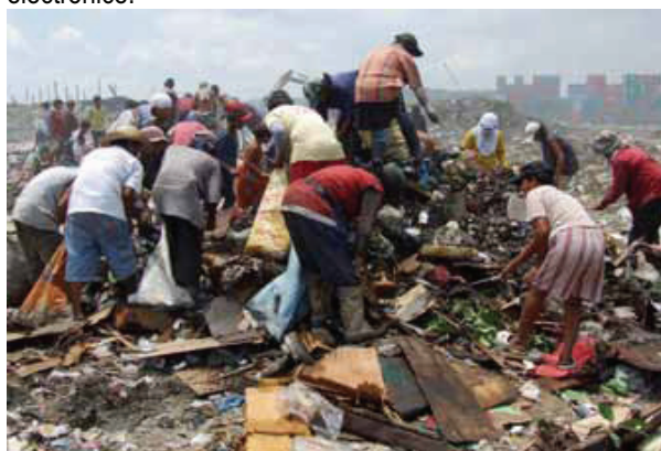
Colectarea de gunoarie

În majoritatea țărilor în curs de dezvoltare, cantitățile în continuă creștere de deșeuri au copleșit capacitățile guvernelor locale de a le gestiona eficient. De foarte multe ori, deșeurile medicale infecțioase și cele industriale toxice nu sunt separate de deșeurile menajere înainte de dezafectarea gropii de gunoi. Activitățile de reciclare sunt în principal efectuate de lucrătorii din economia informală. Se estimează că sunt între 15 milioane și 25 milioane de sortatori de deșeuri la nivel mondial. China, care este cel mai mare generator de deșeuri din lume, deține un număr estimativ de 10 milioane de oameni care lucrează în acest sector 17 . Sortatorii de deșeuri sunt, de obicei, oameni vulnerabili și săraci, adesea femei și copii, care sunt continuu expuși la substanțe periculoase, sticlă spartă și agenți patogeni, și aceștia nu sunt, în general, recunoscuți din punct de vedere social sau economic. Situația este deosebit de dramatică dacă luăm în considerare fluxurile de deșeuri noi, complexe și periculoase, cum ar fi cele electronice.