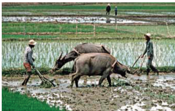
Lucrători muncind pe câmpurile de orez