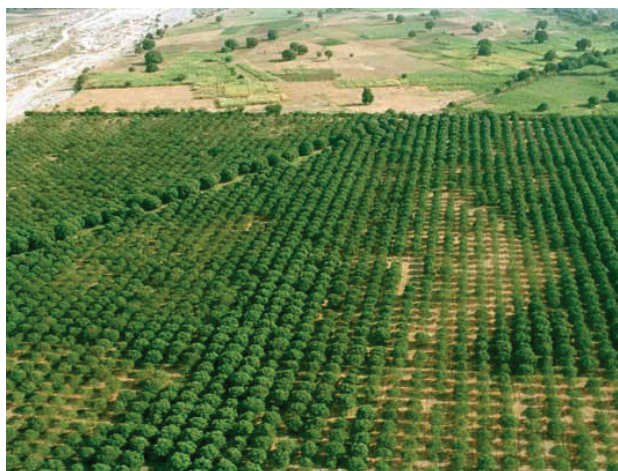
Agricultură în Haiti

Rezoluția referitoare la Contribuția OIM la protecția și îmbunătățirea mediului înconjurător raportat la muncă, OIM, 1972