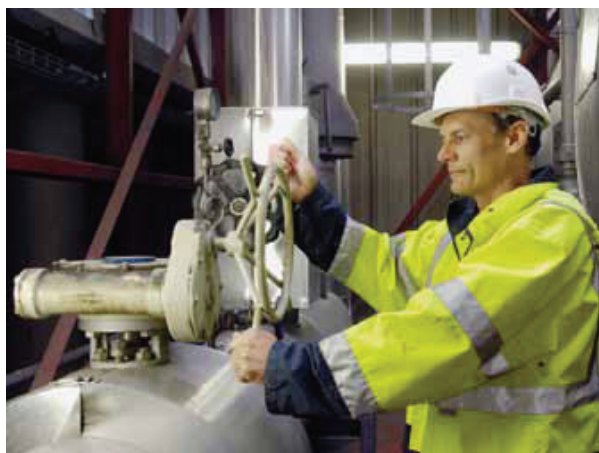
Centru de prelucrare a deșeurilor

Cu scopul general de a cerceta noile tipuri de riscuri legate de locurile de muncă verzi, generate la rândul lor de noile tehnologii, Observatorul European al Riscurilor (ERO) din cadrul Agenției Europene pentru Securitate și Sănătate în Muncă de la Bilbao (EU-OSHA) a publicat în anul 2011 prima serie de studii privind Anticiparea impactului riscurilor noi și emergente asociate tehnologiilor noi utilizate la locurile de muncă verzi asupra securității și sănătății la locul de muncă, până în anul 2020 . 6, 7