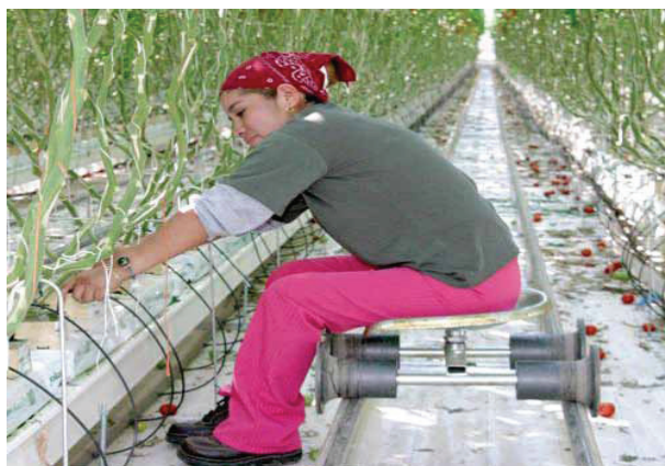
Agricultură hidrofonică (fără sol)

Agricultura durabilă prevede integrarea sănătății mediului, viabilitatea economică și echitatea socială, inclusiv managementul resurselor naturale. De asemenea, agricultura durabilă promovează o reducere în utilizarea, înlocuirea sau eliminarea produselor chimice în agricultură (agrochimicelor), cum ar fi pesticidele, îngrășămintele și alți agenți, precum și utilizarea de măsuri de protecție a solurilor, cum ar fi cultivarea de culturi fără a lucra pământul, îmbogățirea cu materii organice și metode de irigare care permit economisirea apei.