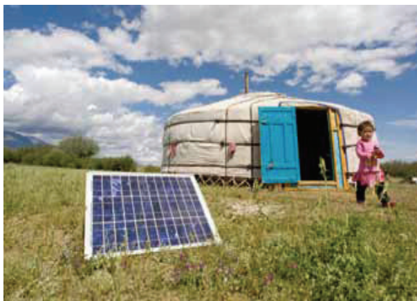
Familie din Mongolia care folosește energia solară pentru electrificarea locuinței

Energia solară poate fi convertită în energie electrică prin utilizarea de panouri fotovoltaice (en.: PV), sau prin procedeul de concentrare a energiei solare (en.: CSP). Sistemele de PV sunt cele mai comune, ele utilizând semiconductori și lumina solară pentru a produce electricitate. Există riscuri profesionale în producerea, instalarea și, la capătul lanțului economic, stocarea deșeurilor la scoaterea din uz a panourilor fotovoltaice. Pentru producerea panourilor fotovoltaice 9 sunt utilizate peste 15 materiale periculoase. Multe riscuri pot să apară din utilizarea produselor chimice în combinație cu siliciu în numeroase procese tehnologice de producție. Producția de celule fotovoltaice implică și un număr de agenți de curățare care pot fi toxici. În consecință, lucrătorii implicați în producerea de module și componente fotovoltaice trebuie să fie protejați împotriva oricărei expuneri la aceste materiale. Panourile solare fotovoltaice ar putea crea un nou flux important de deșeuri electronice la finalul duratei de utilizare (estimată la 20 - 25 de ani), și acestea conțin, la rândul lor, un număr în creștere de materiale noi (cum ar fi telură de cadmiu - CdTe și arsenură de galiu - GaAs), ce reprezintă, din cauza procesului complex de reciclare, o provocare din punctul de vedere al tehnologiei, al SSM și al protecției mediului.