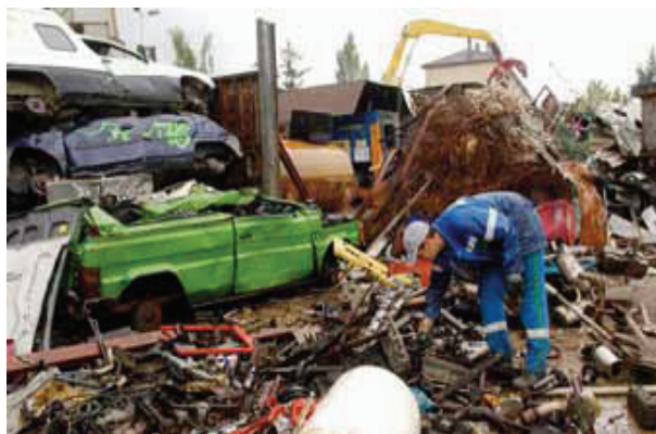
Colector de resturi metalice

riscurilor ca și în cazul oricărui alt loc de muncă, de preferat din faza de proiectare și din stadiile preoperaționale. Aceste evaluări reprezintă și o cale eficientă de a determina dacă o tehnologie care a fost etichetată ca fiind „verde“ nu are sau are un nivel minim de impact asupra mediului.