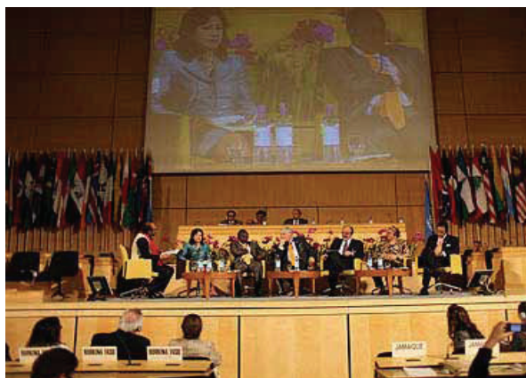
Dezbatere de criză

„Economia verde“ a devenit o emblemă pentru o societate și o economie mai durabile, menite să protejeze mediul pentru generațiile viitoare și să garanteze tuturor oamenilor și tuturor statelor condițiile unei echități sporite și mai incluzive. În consecință, orientarea către o „economie verde“ care, prin crearea de „locuri de muncă verzi“ și „înverzirea“ industriilor, a proceselor de producție și a locurilor de muncă actuale, a devenit elementul cheie pentru atingerea unei dezvoltări economice și sociale durabile din punctul de vedere al mediului. În acest context, incluziunea socială, dezvoltarea socială și protecția mediului ar trebui să se afle în strânsă legătură cu asigurarea de locuri de muncă mai sigure și mai sănătoase și cu o muncă decentă pentru toți.