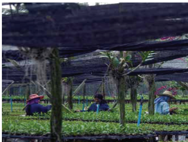
Pepinieră de orhidee

Progresul tehnologic și dezvoltarea economică au depășit întotdeauna de existența unor surse de energie ieftine. Sistemele actuale de producție și transport nu ar putea exista fără combustibili fosili, de care depind în mare măsură. În prezent toată lumea recunoaște că nivelul de gaze cu efect de seră, cum ar fi, în special, dioxidul de carbon și metanul, afectează atmosfera terestră și reprezintă un factor important în schimbările climatice observate.