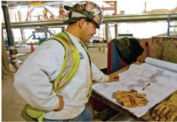
Lucrător în construcții citește planurile clădirii

Astăzi, programele de certificare a construcțiilor ecologice nu iau în considerare securitatea și sănătatea lucrătorilor când evaluează dacă o construcție este sau nu ecologică. Este clar faptul că muncitorii nu lucrează mai în siguranță în construcții verzi, decât în cele tradiționale. Este, prin urmare, esențial să se abordeze cu fermitate aceste pericole tradiționale și să se identifice posibilele noi pericole asociate elementelor ecologice de proiectare în cadrul evaluării riscurilor pentru securitatea și sănătatea lucrătorilor, în scopul fie de a elimina pericolele, fie de a reduce riscurile la minim. Construcțiile verzi oferă oportunitatea de a aborda unele dintre tematicile și problemele care afectează lucrătorii din construcții, dar acest lucru necesită implicare. În plus, lucrătorii din construcții care nu sunt sindicalizați sau sunt migranți vor fi expuși la riscuri mai mari.