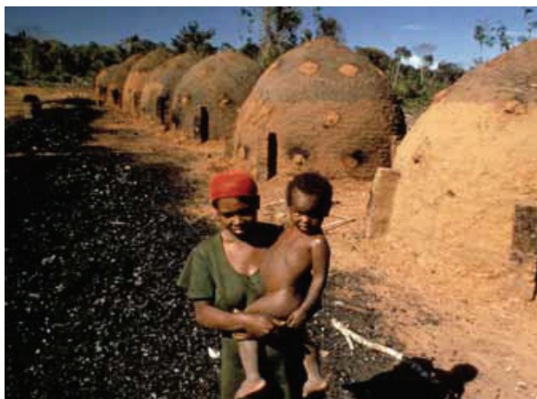
O mamă cu copilul ei, în fața cuptoarelor de producere a cărbunelui

competențe ale lucrătorilor, pentru a îmbunătăți măsurile de securitate socială, și pentru a mai ușura procesul de tranziție. În acest context, dialogul social tripartit și negocierile colective joacă un rol important.