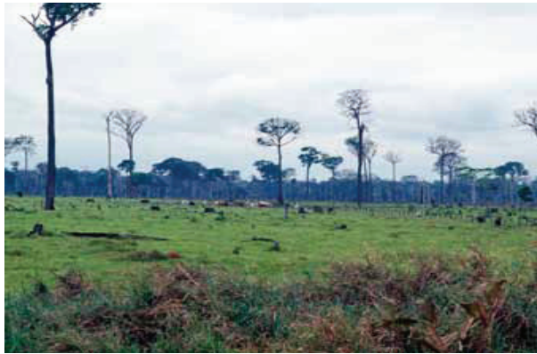
Despădurire în Brazilia

O diferență esențială este faptul că un management durabil se bazează pe lucrători competenți și urmărește protejarea lor. Evoluția locurilor de muncă verzi în acest sector va depinde de includerea condițiilor pentru o muncă decentă în practica administrării durabile a pădurilor. Normele referitoare la munca decentă, inclusiv recomandările de aplicare a ghidurilor OIM privind SSM în silvicultură, precum și preocupările sociale ale comunităților locale, fac parte din principalele norme forestiere mai importante de certificare pentru o silvicultură durabilă (en.: FSC și PEFC). Ele sunt deja extinse la lanțul de valori din aval, în industria lemnului, celulozei și hârtiei. Sindicatele au militat în mod constant pentru includerea principiilor din normele internaționale de muncă ale OIM în sistemele de certificare, pentru a asigura protecția drepturilor lucrătorilor.