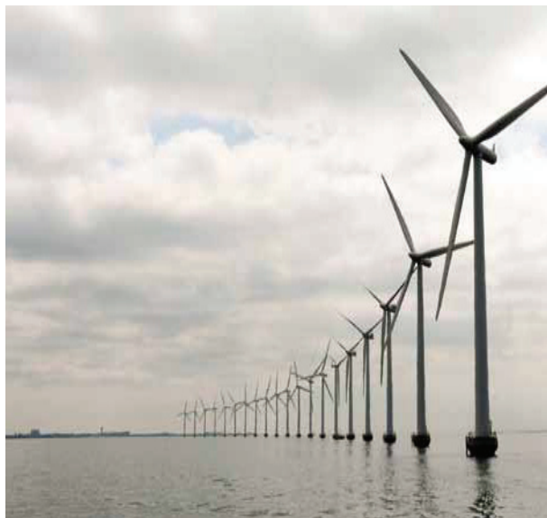
Parcul eolian marin Middelgruden, Danemarca

Agenda privind munca decentă, a OIM, precum și numeroasele norme de securitate și sănătate, promovează principiile universale aplicabile oricărui tip de sistem economic sau loc de muncă și contribuie la dezvoltarea durabilă. Mai mult, unele dintre standardele de SSM sunt relevante și pentru protecția mediului. Ele sunt, prin urmare, deosebit de importante în ceea ce privește modul în care locurile de muncă verzi pot deveni exemple de locuri de muncă mai sigure, mai sănătoase și decente.