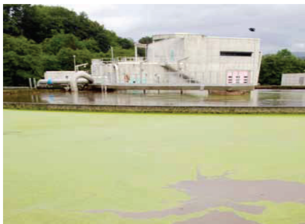
Centru de prelucrare a deșeurilor

Tranziția către o economie verde presupune o schimbare drastică a paradigmei dezvoltării care prevalează, ceea ce necesită în schimb un larg sprijin social. Spre deosebire de „revoluțiile” anterioare, de data aceasta, măsurile luate nu pot fi numai de natură tehnologică sau economică. Consolidarea bunăstării populației lumii trebuie să fie parte integrantă a procesului de realizare a dezvoltării durabile. Această schimbare de paradigmă presupune că, în timp ce riscurile pentru mediu vor fi reduse, echitatea socială și bunăstarea oamenilor trebuie să înregistreze o creștere.