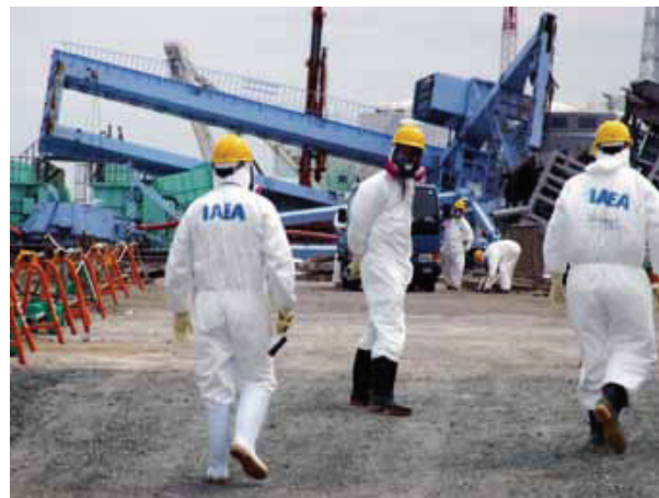
Inspecție a AIEA la o centrală nucleară

Există opinii diferite cu privire la energia nucleară, dacă ar trebui să facă parte sau nu din mixul energetic viitor al unei economii verzi. Pentru mulți, energia nucleară nu este o alternativă la combustibilii fosili acceptabilă pentru mediu, având în vedere problemele nerezolvate de securitate, de sănătate și de mediu legate de funcționarea centralelor electrice și de deșeurile radioactive rezultate, periculoase și cu durată mare de viață. Partizanii energiei nucleare subliniază aspectele ei pozitive, mai ales cele referitoare la impactul global redus asupra schimbărilor climatice. În timpul funcționării, nu generează efectiv emisii de gaze cu efect de seră sau gaze acide (în special dioxid de sulf și oxizi de azot), spre deosebire de arderea combustibililor fosili (cum ar fi cărbunele și gazele naturale).