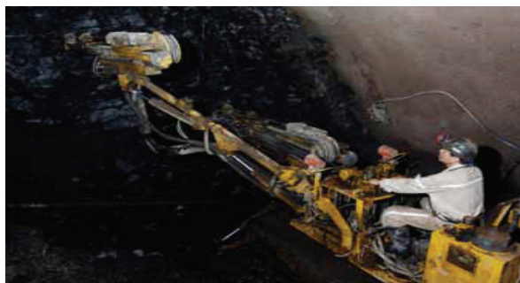
Mină de cărbune în China

Mineritul, atât cel de suprafață, cât și cel subteran, este unul dintre sectoarele cele mai periculoase. Operațiunile din exploatarea miniere pot expune lucrătorii la o gamă largă de riscuri ce ar putea provoca vătămări, boli profesionale sau deces; acestea nu sunt discutate în detaliu aici. Cu toate acestea, printre riscurile asociate activităților miniere și celor extractive se numără: riscul de incendiu și explozie, electrocutare, expunerea la pulberi de siliciu, la mercur și la alte substanțe chimice, precum și la căldură. Silicoza este una dintre cele mai grave boli profesionale. Este o boală pulmonară incurabilă provocată de inhalarea de pulberi care conțin siliciu cristalin liber. Cu potențialul său de a conduce la invaliditate fizică treptată și permanentă, silicoza continuă să fie una dintre cele mai grave boli profesionale din lume.